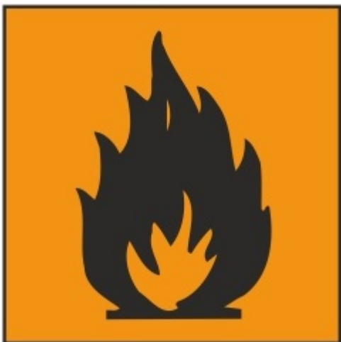
Fx Yderst brandfarlig